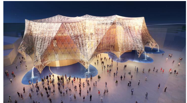
<自治体館: 大阪ヘルスケアパビリオン>