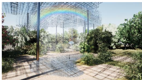
<宮田 裕章氏> Better Co-Being