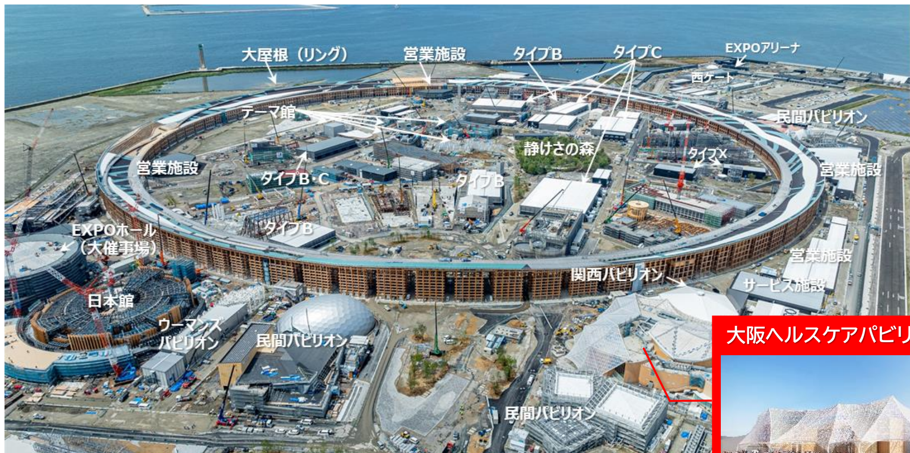
大阪ヘルスケアパビリオン