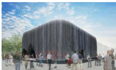
<石黒 浩氏> いのちの未来