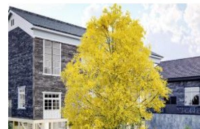
<河瀬 直美氏> Dialogue Theater - いのちのあかし -