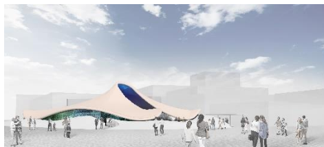
<福岡 伸一氏> いのち動的平衡館

© DYNAMIC EQUILIBRIUM OF LIFE / EXPO2025