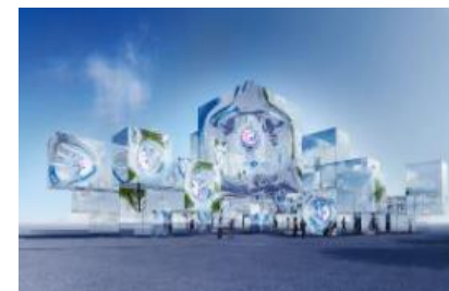
<落合 陽一氏> null 2

©2024 Yoichi Ochiai / 設計:NOIZ / Sustainable Pavilion 2025 Inc. All Rights Reserved.