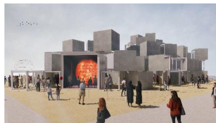
<河森 正治氏> いのちめぐる冒険

© 2024 Shoji Kawamori/Office Shogo Onodera, All rights reserved.