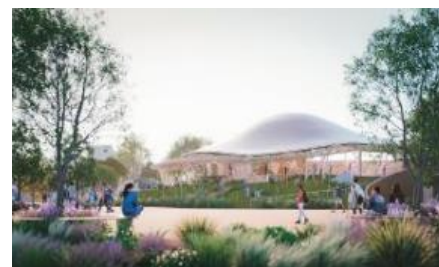
<中島 さち子氏> いのちの遊び場 クラゲ館

©steAm Inc. & Tetsuo Kobori Architects All Rights Reserved