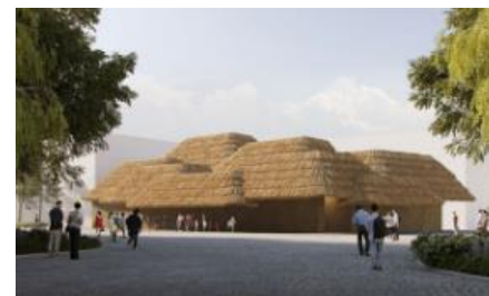
<小山 薫堂氏> EARTH MART

© 2024 Shoji Kawamori/Office Shogo Onodera, All rights reserved.