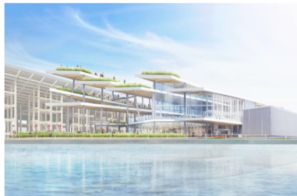
<EXPO ナショナルデーホール>