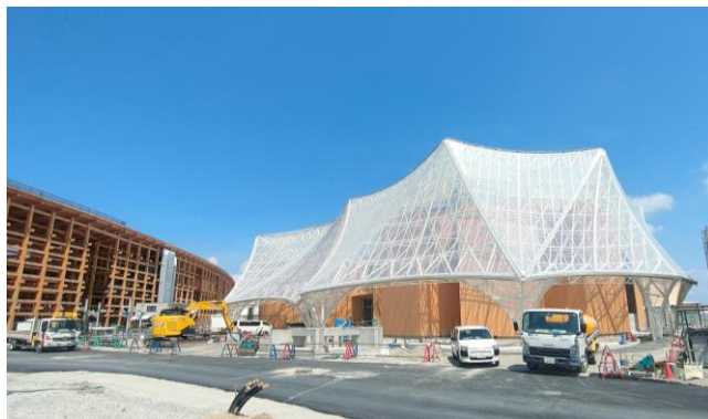
②外観東寄り（8月14日撮影）