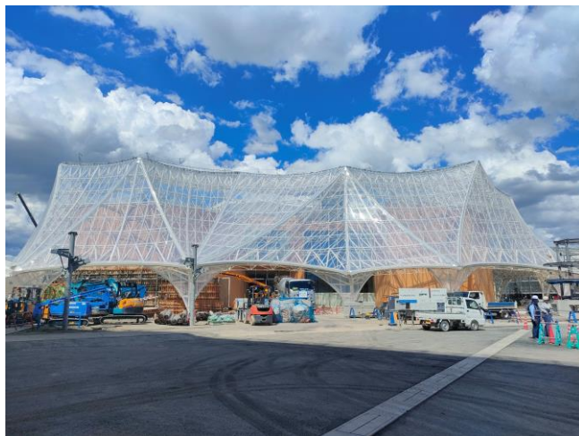
②外観東寄り（8月14日撮影）